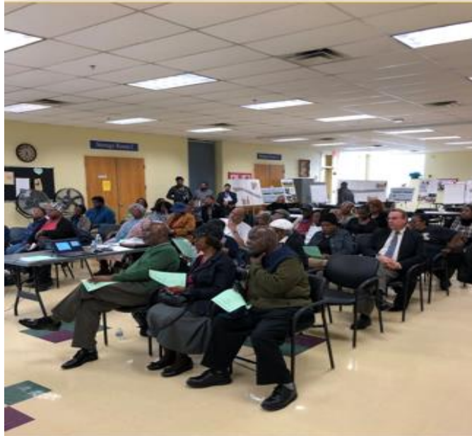
Funded by the Maryland Department of Planning